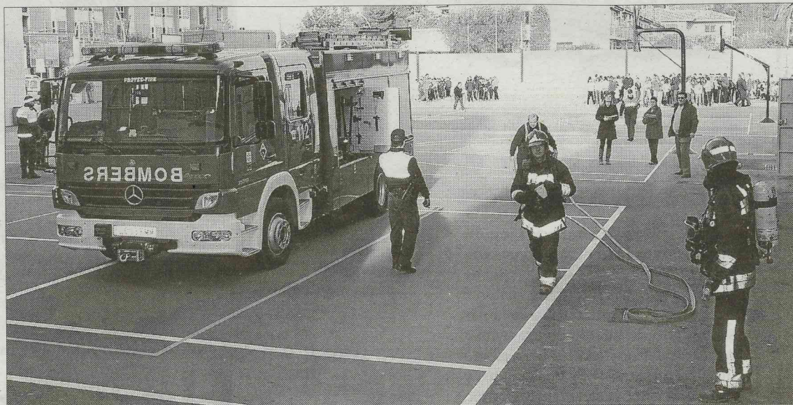
El patio se convierte en el centro de operaciones para los servicios de Protección Civil.