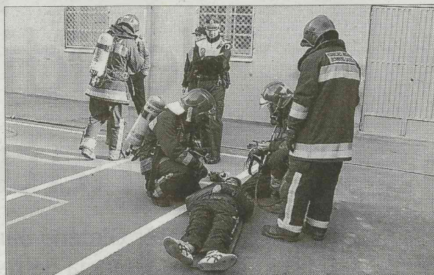
Los bomberos simulan el rescate de un estudiante