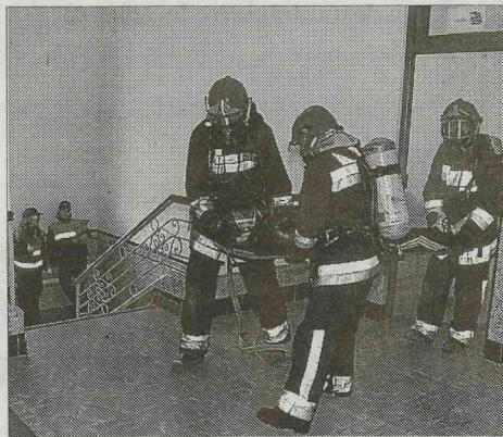
La evacuación, un momento tenso.